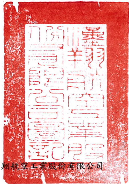
乙 方：漢翔航空工業股份有限公司